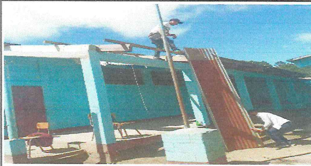
Foto1: Quitando la lamina del techo del corredor